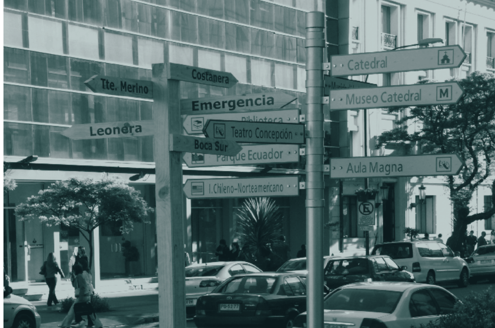
Figura 1: Señalética. Escultura móvil que circuló por la Plaza de la Independencia. Concepción, octubre de 2008.