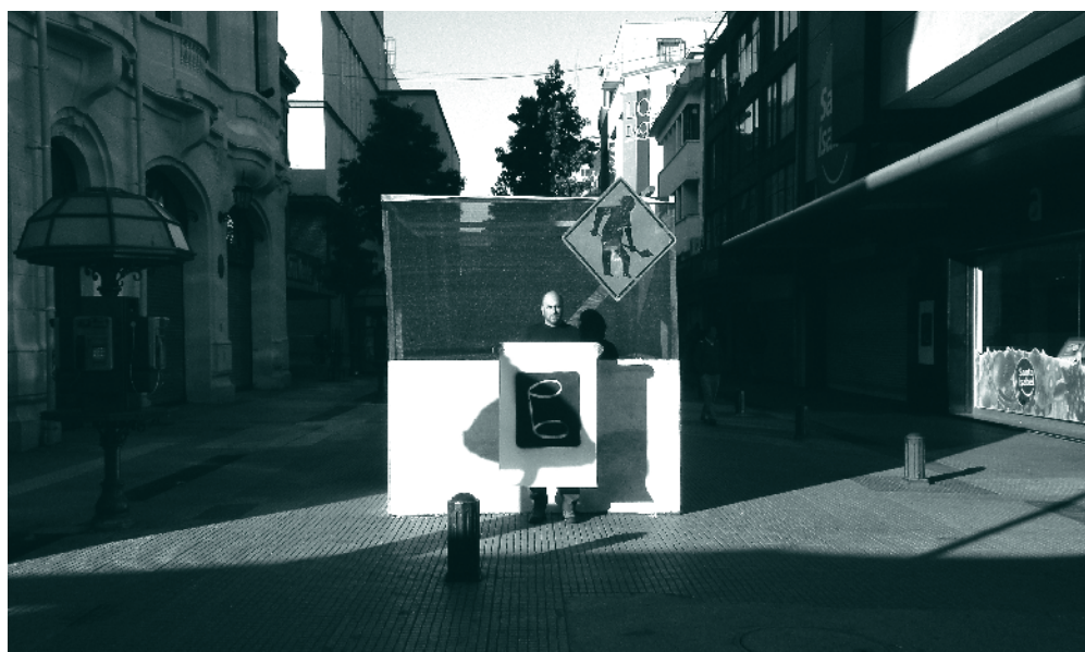
Figura 2: Marca. Intervención realizada en las fachadas de tiendas comerciales situadas en el paseo peatonal Alonso de Ercilla. Concepción, enero de 2009.

Sobre un trasfondo inestable, el arte contemporáneo penquista ha visto emerger renovadas condiciones de posibilidad en el trabajo de artistas que hacen del espacio público una activa plataforma de experimentación. En su mayoría efímeras, y rozando el linde de la invisibilidad, las obras de Óscar Concha aquí referidas persiguen conflictuar las economías de sentido que norman la vivencia cotidiana, atravesando ámbitos vinculados a la memoria colectiva, la estetización de la experiencia y la fragmentación social que opera en el diagrama urbano.