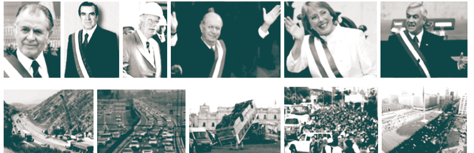
Decreto-ley n°161 MOP, 1991. “Improvisación de liberada” y extensión de instrumentos: desde autopistas interurbanas a urbanas.

En esta primera transposición, el instrumento contractual de concesiones sufrió cambios marginales, pese a que el contexto de aplicación era radicalmente distinto: las obras ya no se ejecutaban en territorios rurales, sino en zonas urbanas densamente