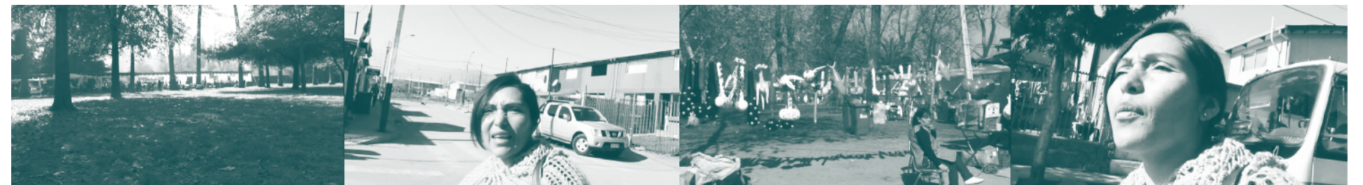
Figura 2. Conformación material del paisaje migrante mediante el seguimiento en el entorno urbano y el contraste.

ciencia positivista —la apertura a interpretaciones— es una virtud en el conocimiento desde la narrativa (Czarniawska, 2004).