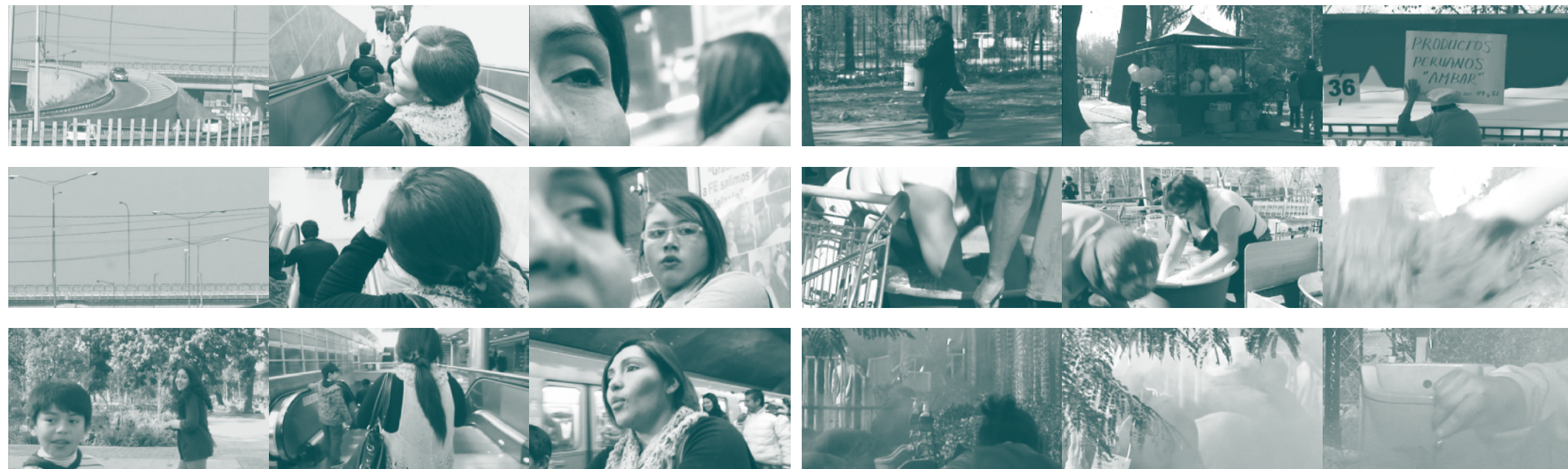
Figura 3. Conformación material del paisaje migrante contrastando los dos viajes realizados en el video. La espectadora, la productora.

para capturar el contraste entre el paisaje de la asistente a la fiesta y el paisaje de la fiesta misma (Fig. 1).