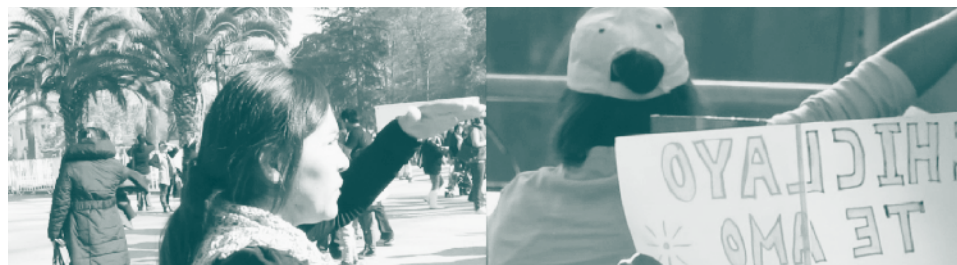
Figura 1. Montaje visual como forma de articular y confrontar imágenes de mensajes contrapuestos y la distancia que establece la protagonista respecto a la fiesta.