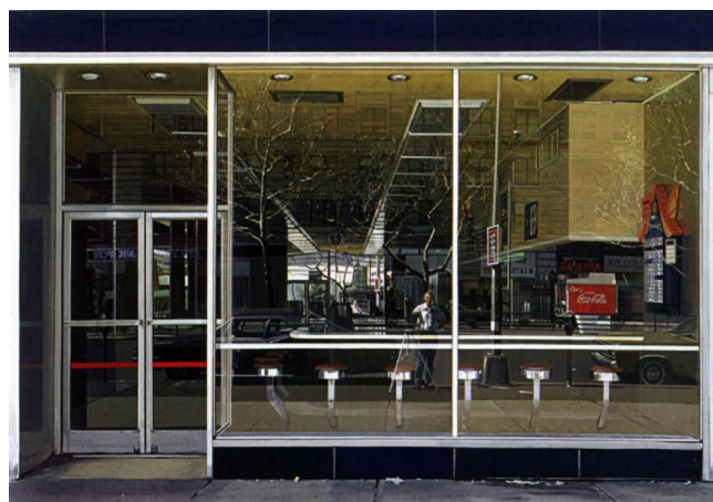
Figura 4. Richard Estes, 1976, Double Self-Portrait. Óleo sobre lienzo, Museum of Modern Art, New York.

enmascara la intención que apunta justamente a dar a conocer esa condición de la verdadera realidad urbana , de aquella que forma parte del habitar de la ciudad, del desarraigo tardío de la industrialización, de un registro de época que da cuenta de un instante preciso. El arte aparece de esta manera como territorio inexpugnable de la condición crítica del acontecer urbano, como una manifestación de aquella condición ineludible que es el pensar sobre aquel habitar, que puede estar enmascarado bajo un virtuosismo que busca el asombro del público o los favores del mercado, pero que bajo esa lectura se muestra crítico acerca de la realidad que representa.