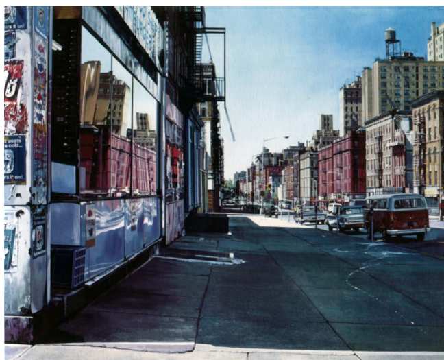
Figura 3. Richard Estes, 1974, Columbus Avenue at 90th Street. Óleo sobre lienzo, Marlborough Gallery, Nueva York.

La condición pictórica de la obra de Estes le permite ampliar esa matriz de engaño que está referida no solo a la representación verosímil de una realidad urbana, lo que