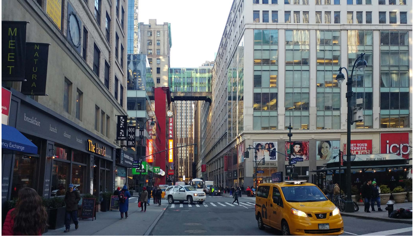
Figura 5. Vista de Nueva York, Broadway con W 32nd Street, 2018.