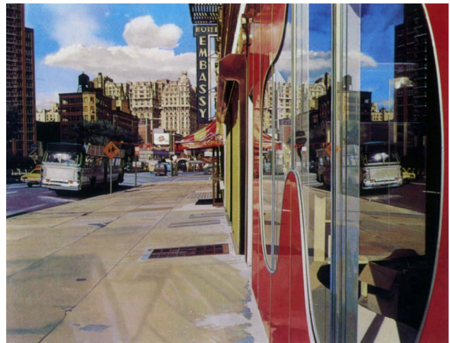
Figura 1. Richard Estes, 1972, Bus Reflections (Ansonia). Óleo sobre lienzo, Louis K. Meisel Gallery.

“¿Donde reside el peso mayor del estar allí , en el estar o en el allí ?” (Bachelard, 2000, p. 252), es la pregunta que plantea Bachelard al hablar de la dialéctica de lo de dentro y de lo de fuera, que parece ser la pregunta que Estes le inquiera al espectador en la medida en que hace compartir el hastío de la urbe deshabitada, en una escenografía